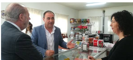
Visita al Centro Cívico Deportivo.

Y es que además de la renovación de la cubierta de la Sala de Exposiciones, se ha actuado en numerosos puntos del casco urbano, entre los que destacan la construcción del Centro Cívico Deportivo o el Vivero de Empresas, financiado con los Planes Supera, Empleo Estable y el PFOEA.